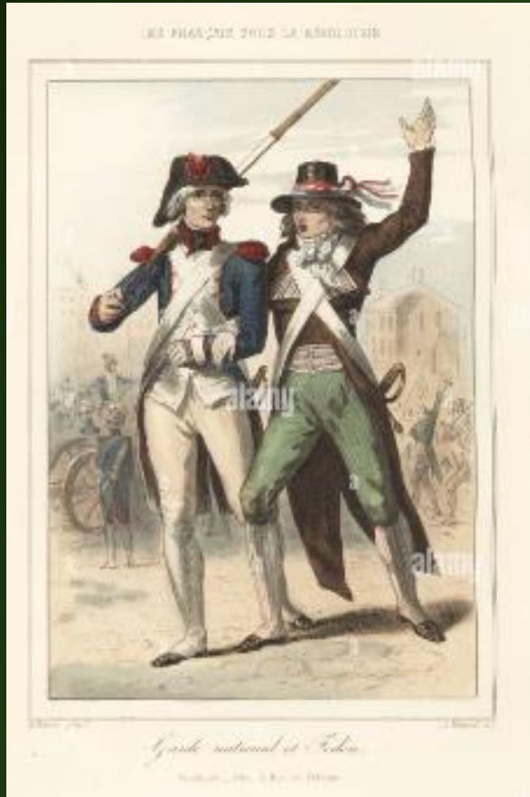
Ejército y Guardia Nacional durante la revolución francesa